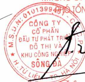
Trần Việt Dũng